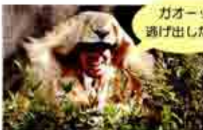
ガオーツ 逃げ出したぞ