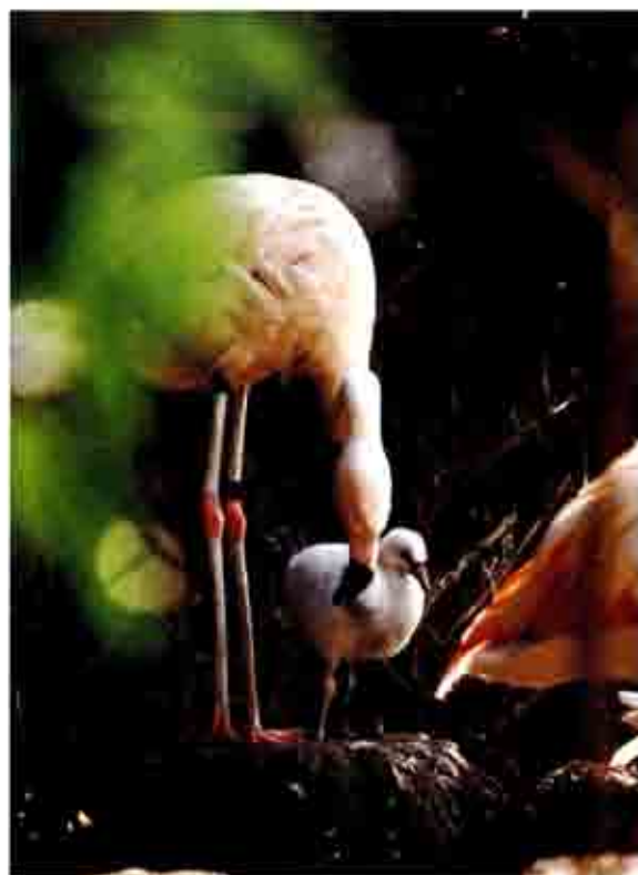
↑フラミンゴが子育て中です。(撮影日不明)