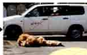
やったぞ！ 麻酔銃命中！