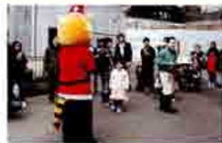
レッサーサンタさん ありがとう

1月12日 もちつき大会 成人の日記念ビルマニシキヘビ メス(ミナミ)と新成人記念撮影