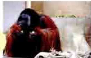
ごちそうさま☆ ブロッコリーは 苦手なんだ

2月11日 シナロアミルクヘビ オス 昨年、尾の上方の箇所膨らみがあり切開し取り除いたが、また膨らんでいたため手術をし脂肪の塊を取り除く。