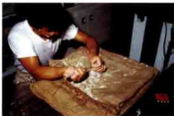
↑フラミンゴの雛を人工保育している所です。(昭和62年7月25日撮影)