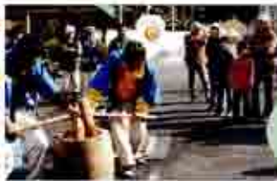
はやく たべたいなあ