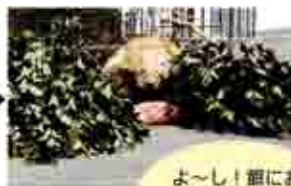
よ〜し！餌にお びき出されたぞ