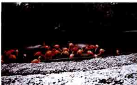
↑静岡市で珍しく雪が積もったときの風景です。最近では温暖化の為か動物園付近で雪が降ることはめったにありません。(平成6年2月11日撮影)

↓夜のフラミンゴです。写真では分かりにくいと思いますが、夜見るととても幻想的な雰囲気に包まれます。