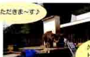
♪大熱望 Happy Birthday♪