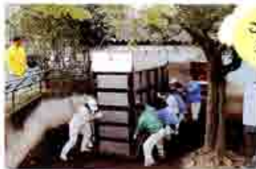
この中にゲンが入っています