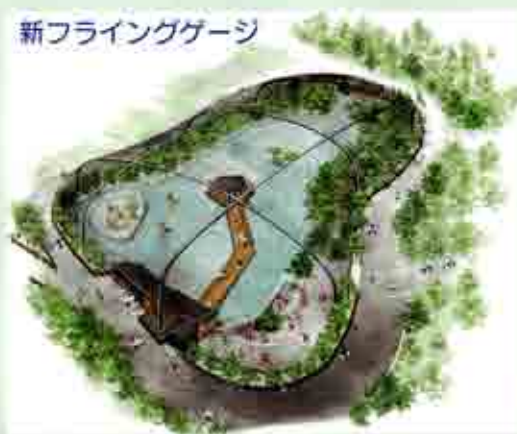
新フライングケージ

その後も、平成22年度建設の新爬虫類館、23年度建設のレッサーパンダ館、ビジターセンター、23から24年度にかけて建設のペンギン館、ゲートエリアなど、順次再整備が続きます。楽しみにしてください。