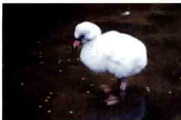
↑フラミンゴの雛の写真です。まだ生まれてから間もないので羽はピンク色ではありません。(昭和62年8月5日撮影)

このうちのベニイロフラミンゴとチリフラミンゴはなんと開園当時から飼育されている個体がいます。フラミンゴはめったに病気をすることがなくとても長生きです。反面、繁殖が一度止まってしまうとなかなか増えません。